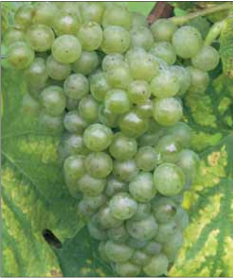
Abb. 3: «Completer».

den zurückgedrängt. Heute hat sich der Sortenspiegel dank der Internationalisierung und Neuzüchtungen wiederum stark erhöht, so werden im Kanton Graubünden über 40 Rebsorten ( www.graubuendenwein.ch ) und im Kanton Zürich sogar über 80 Sorten ( www.strickhof.ch ) angebaut.