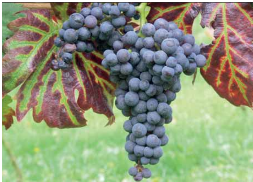
Abb. 2: «Erlenbachertraube».

Zur Bekämpfung der Reblausgefahr ist in den meisten Weinbaugebieten heute die Anpflanzung von Pfropfreben, das heisst veredelten Reben, vorgeschrieben. Aus diesem Grund ist vielerorts auch die Sortenvielfalt stark reduziert worden. Weitere Gründe für den Sortenrückgang sind die Aufgabe des